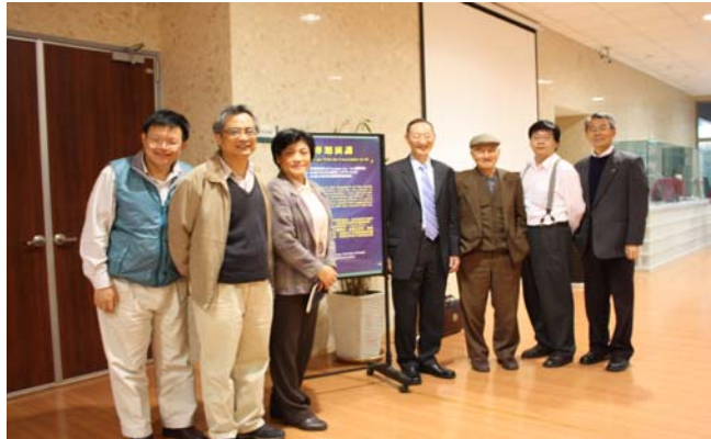
圖 4. 合照